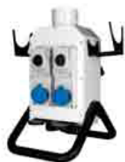
Vue arrière jolly 2 (mise en marche manuelle)