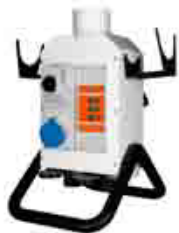
Vue arrière jolly (mise en marche Automatique)